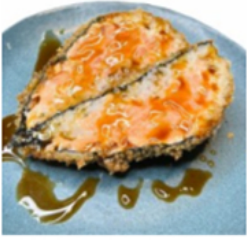
Hot Temaki Sem descrição Pedido ilimitado (cód. 105)