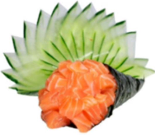
Salmão Servido por unidade. Pedido ilimitado