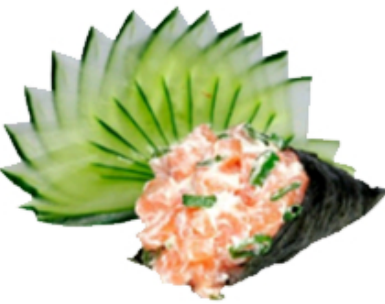
Patê de Salmão Servido por unidade. Pedido ilimitado