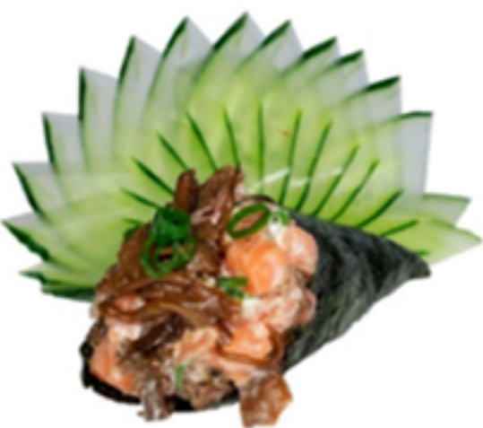
Patê de Salmão com Shimeji Servido por unidade. Pedido ilimitado