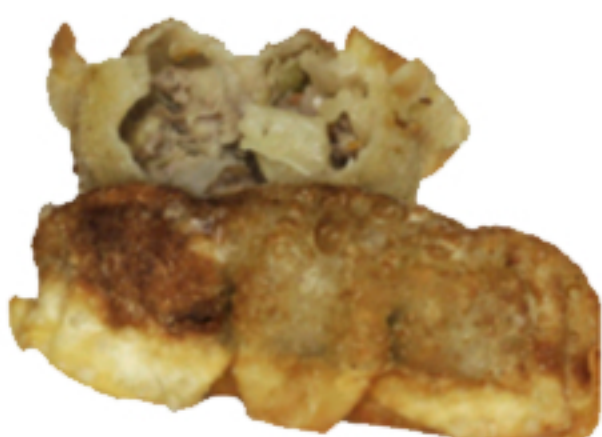
Bovino Servido por unidade. Pedido ilimitado