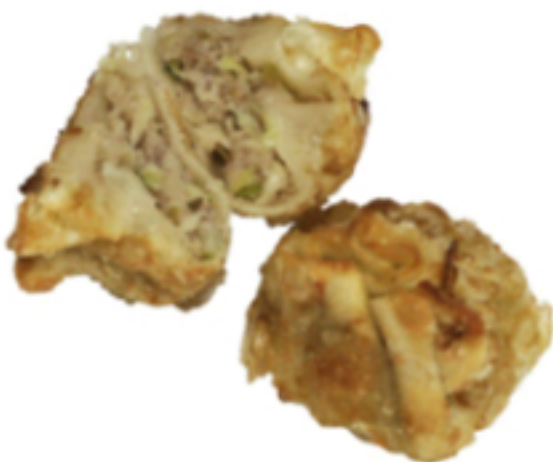
Suíno Servido por unidade. Pedido ilimitado