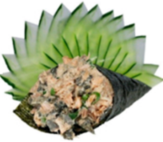
Patê de Skin Servido por unidade. Pedido ilimitado